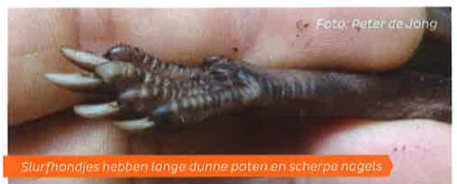
Slurfhondjes hebben lange dunne poten en scherpe nagels